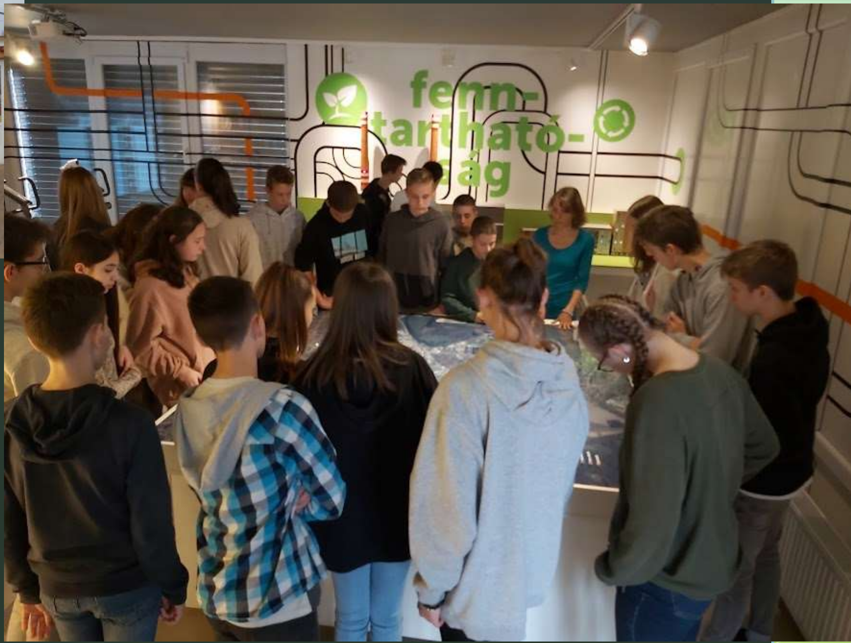
Pécsi Hőerőmű üzemlátogatása